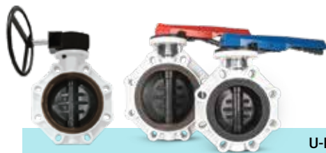
شیر پروانه‌ای صنعتی U-PVC