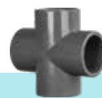
چهارراه ۴۵ درجه U-PVC